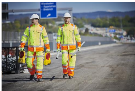
Dynamic Reflect, voor iedereen die op zoek is naar hoge zichtbaarheidskleding met maximale bewegingsvrijheid en flexibiliteit.

MEWA biedt zijn signalisatiekleding uitsluitend aan in een full-service systeem. Elke medewerker beschikt zo over meerdere outfits die op afgesproken tijdstippen worden opgehaald om ze vakkundig te laten wassen én herstellen. Vieze fluorescerende stoffen en vervaagde reflecterende strepen verminderen de zichtbaarheid en dus ook de veiligheid. Het is daardoor letterlijk van levensbelang dat de signalisatiekleding regelmatig wordt gecontroleerd. En dat is precies wat we bij MEWA doen. Na elke wasbeurt controleren we elk kledingstuk op functionaliteit. Zo bent u er zeker van dat uw signalisatiekleding professioneel en volgens de laatste technieken wordt gerepareerd, zodat de beschermende werking steeds wordt gehandhaafd.