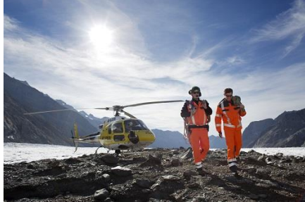
La ligne de vêtements de signalisation spéciaux Hi-Vis garantit une sécurité optimale dans toutes les conditions de lumière.