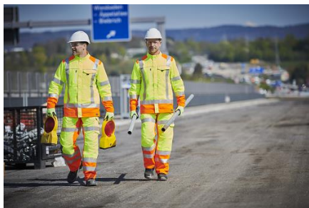
Dynamic Reflect s'adresse à tous ceux qui recherchent des vêtements haute visibilité offrant une liberté de mouvement et une flexibilité maximales.

MEWA propose ses vêtements de signalisation exclusivement dans un système de service complet. Chaque collaborateur possède plusieurs tenues qui sont collectées à des moments convenus pour être lavées et réparées professionnellement. Les tissus fluorescents sales et les bandes réfléchissantes délavées réduisent la visibilité et donc la sécurité. Il est donc littéralement vital que les vêtements de signalisation soient contrôlés régulièrement. Et c'est exactement ce que nous faisons chez MEWA. Après chaque lavage, nous vérifions la fonctionnalité de chaque vêtement. Vous pouvez ainsi être sûr que vos vêtements de signalisation sont réparés de manière professionnelle et selon les techniques les plus récentes, afin que l'effet protecteur soit toujours maintenu.