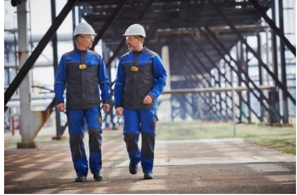
Een uniforme uitstraling als team in werk- en beschermende kleding