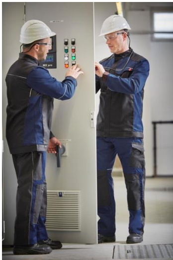
Specifieke bescherming, dezelfde look