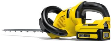
De draadloze heggenschaar HGE 18-50 Battery van Kärcher.