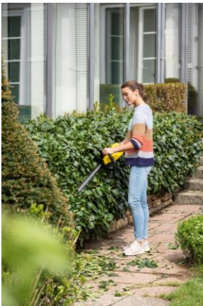
De draadloze heggenscharen imponeren door hun nauwkeurige snijbewegingen, ergonomisch gebruik en slimme accessoires.