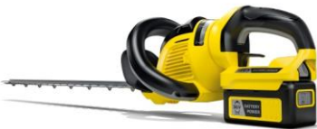
De draadloze heggenschaar HGE 36-60 Battery van Kärcher.