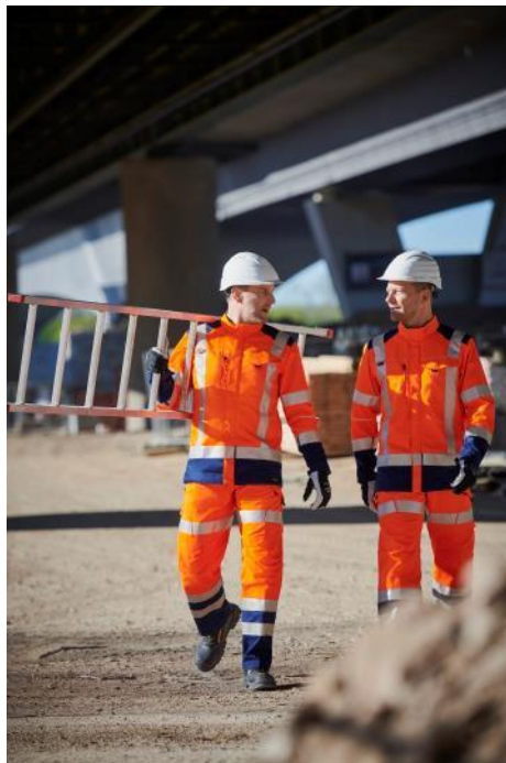
Korte dagen, grijs weer, slechte zichtbaarheid. Iedereen die dan buiten, op de weg of op de bouwwerf werkt, heeft signalisatiekleding nodig