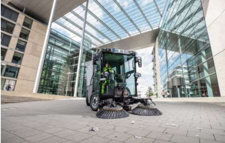
...grover vuil tussen gebouwen opnemen...